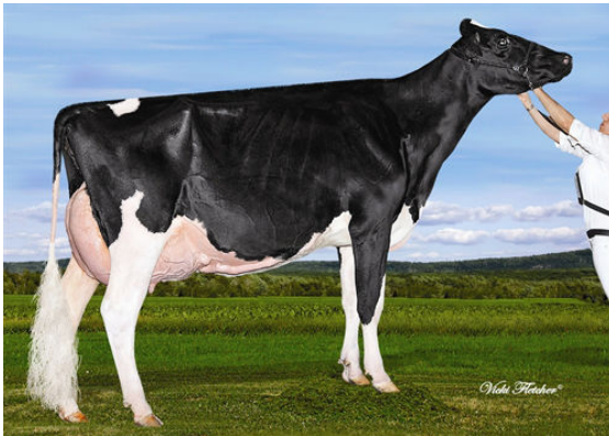
MS PRIDE GOLD INVITE 761 FOURTH DAM